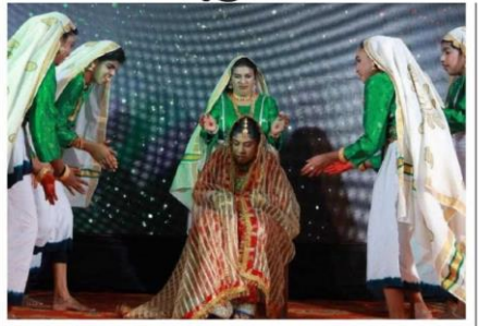
ലില്ലി ലയൺസ് സ്പെഷൽ സ്കൂൾ വാർഷിക ദിനാഘോഷത്തോടനു ബന്ധിച്ച് വിദ്യാർഥികൾ അവതരിപ്പിച്ച ഒപ്പന